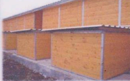
zadní část kotců - boudy budou na nožkách