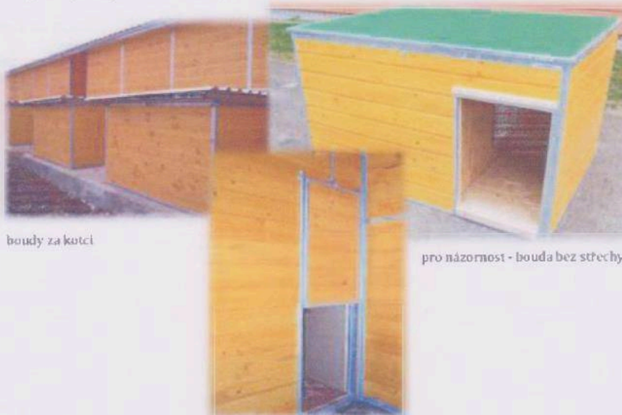
boudy za kotci

Rohy boudy, vstupní otvor i otvor v přiče chráněn žárově zinkovaným ocelovým plechem tl. 2 mm.