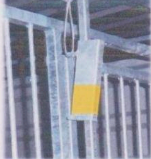
ovládní padacích dveří