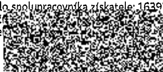
Podpis zástupce pojistitele (získatele)