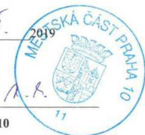
ÚMČ Praha 10 Ing. Filip Koucký vedoucí OMP