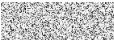
pronajímatel statutární město Jihlava František Zelníček, náměstek primátora