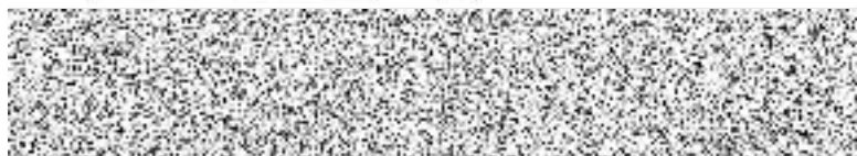
Statutární zástupce příjemce služby