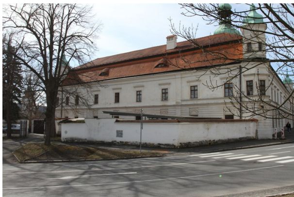
1. Zed' SV pohled