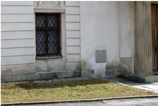
3. Zavlhávaní zdiva