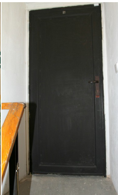
7. Dveře do podkroví klimatizace