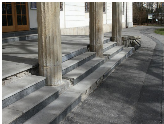
2. Stávající stav schodiště a sloupů 04/2018