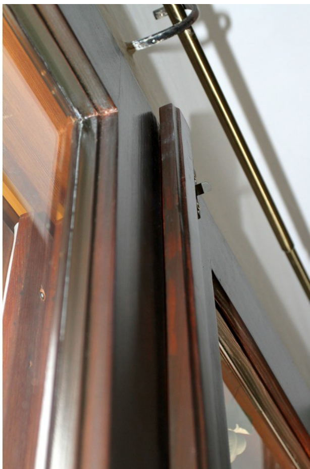
1.b Deformované křídlo dveří spára