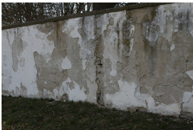
3. Snímek poškození omítky