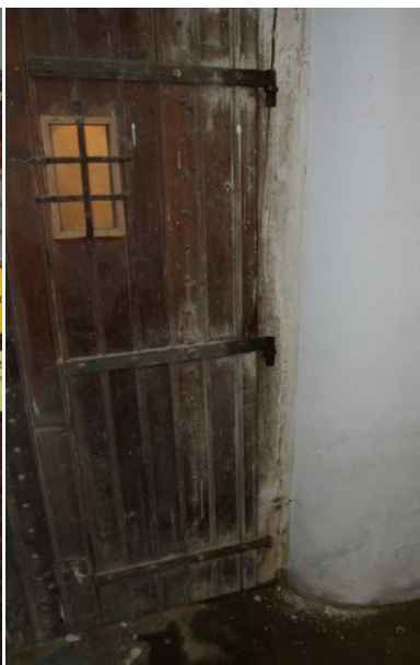
9b. Uvolněné zárubně, futra