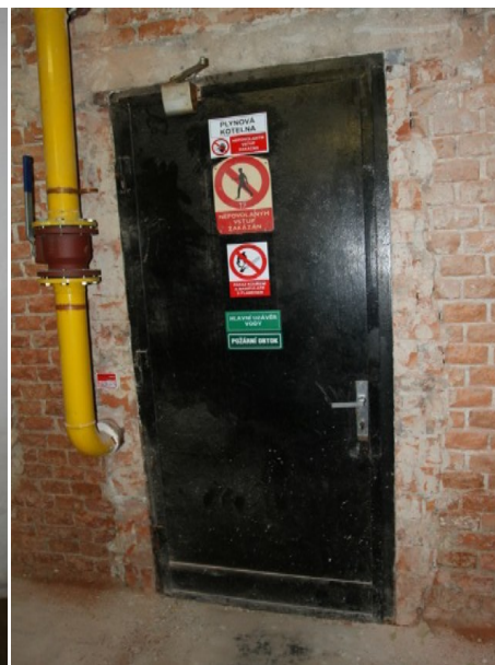
10. Dveře do kotelny