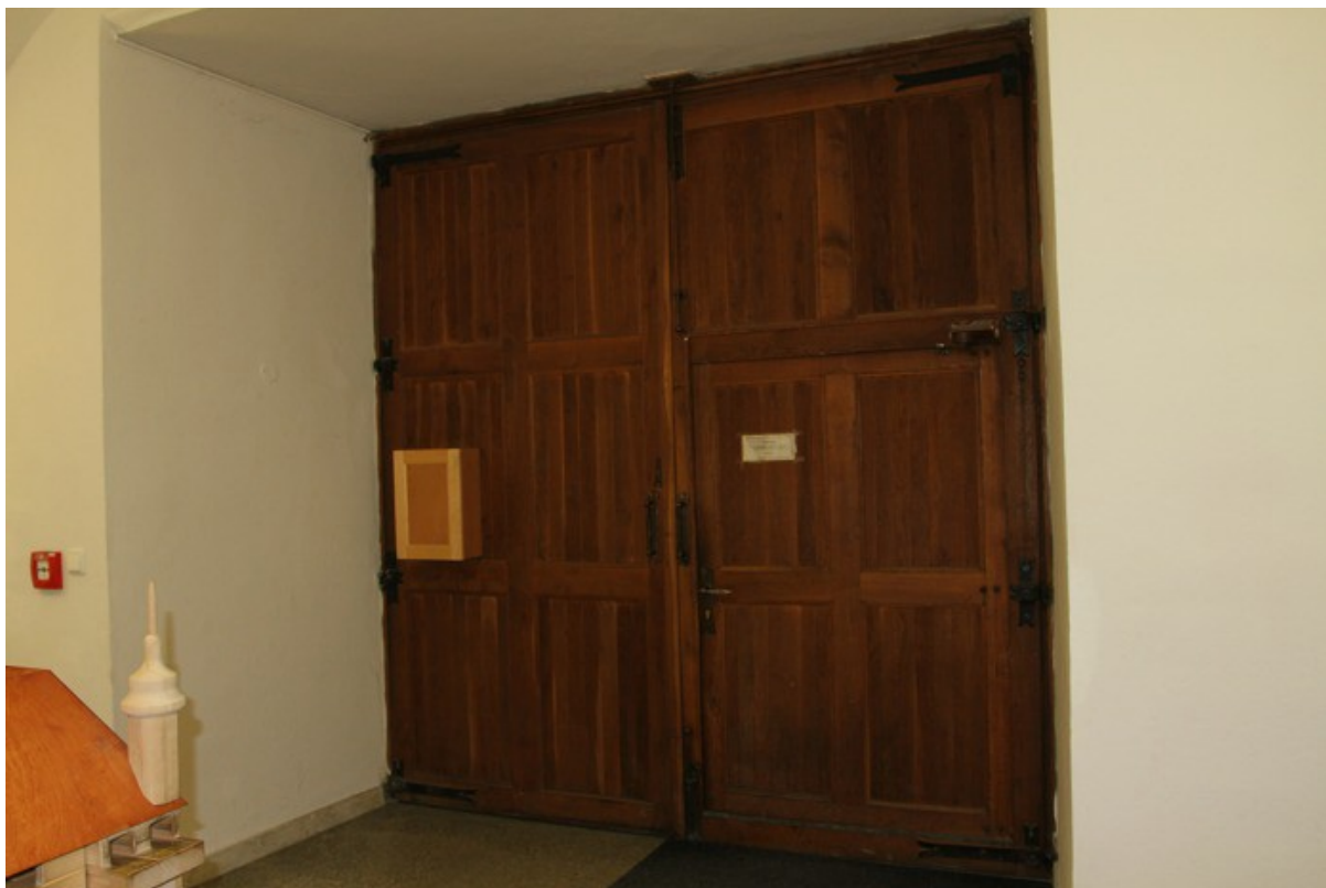
3.b Boční vstupní dveře pohled ze zámku