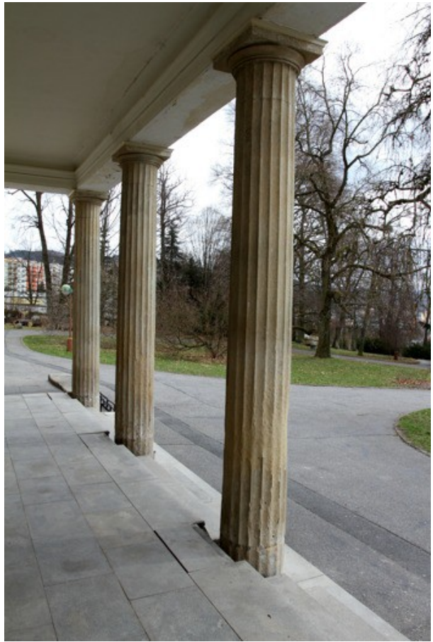
6. Stávající stav