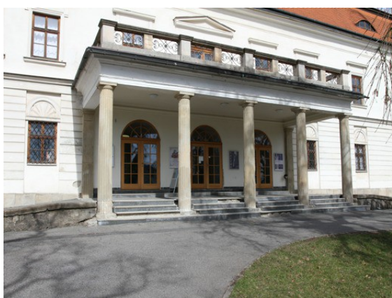
3. Celkový pohled 04/2018