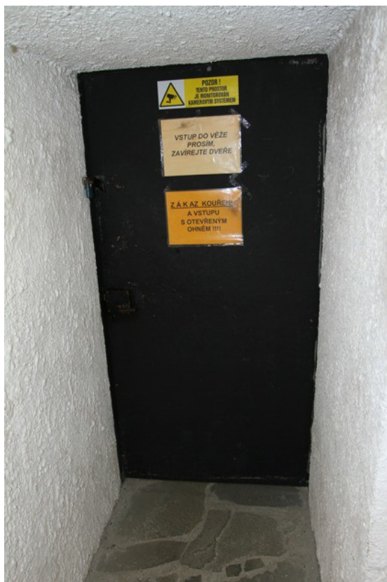
4.a Dveře do věže