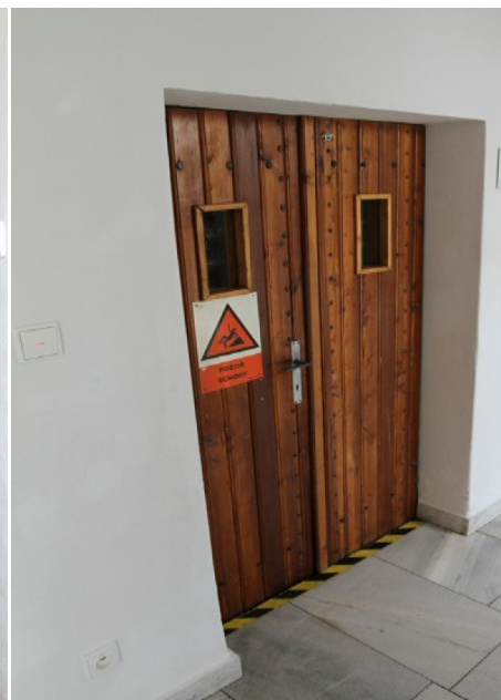
8. Dveře do sklepa zámku