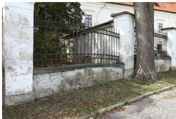
2. Zed' s mříží