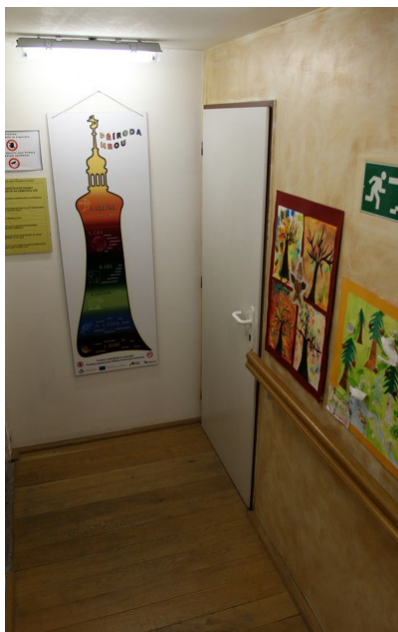
6. Dveře do podkroví