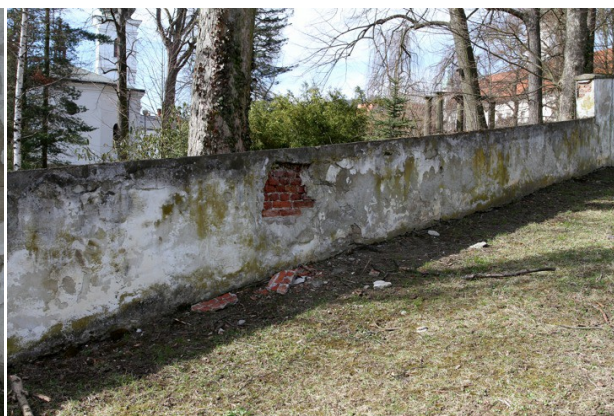
4. Poškození zdiva