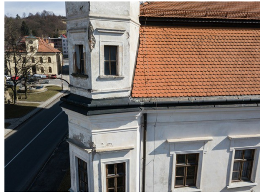
2. JV nároží zámku