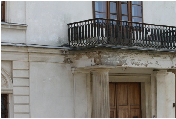
1. Balkón nad bočným vstupem