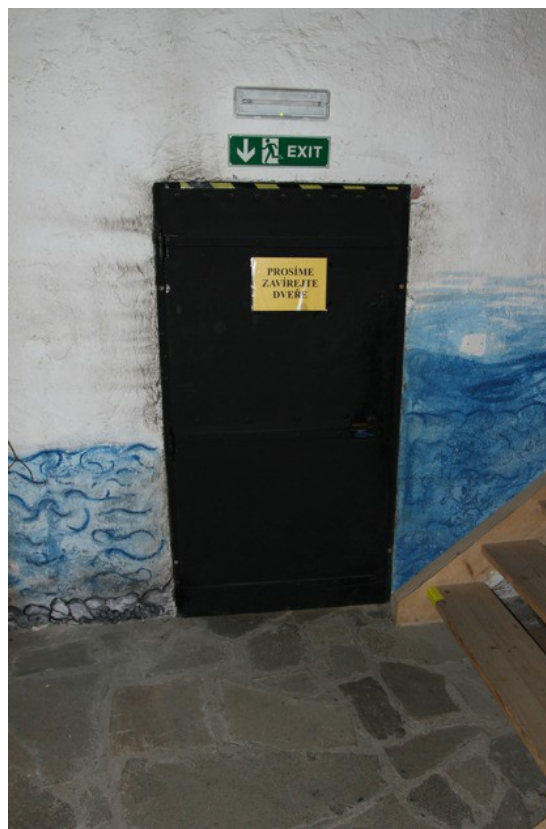
4.b Dveře do věže