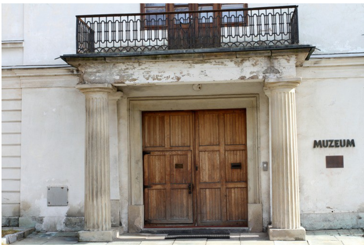
3.a Boční vstupní dveře pohled z ulice