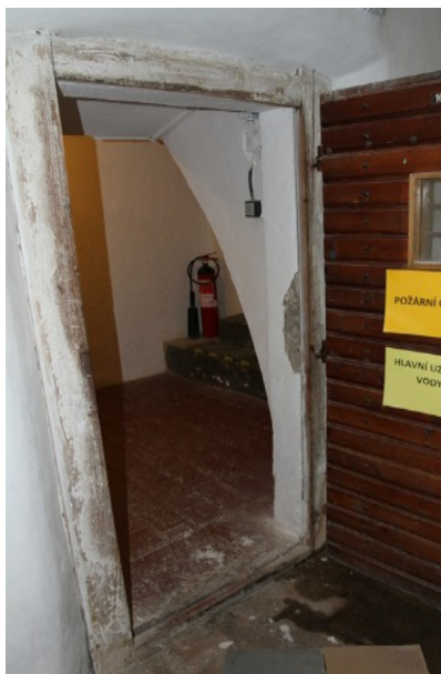
9a. Dveře ve sklepních prostorách