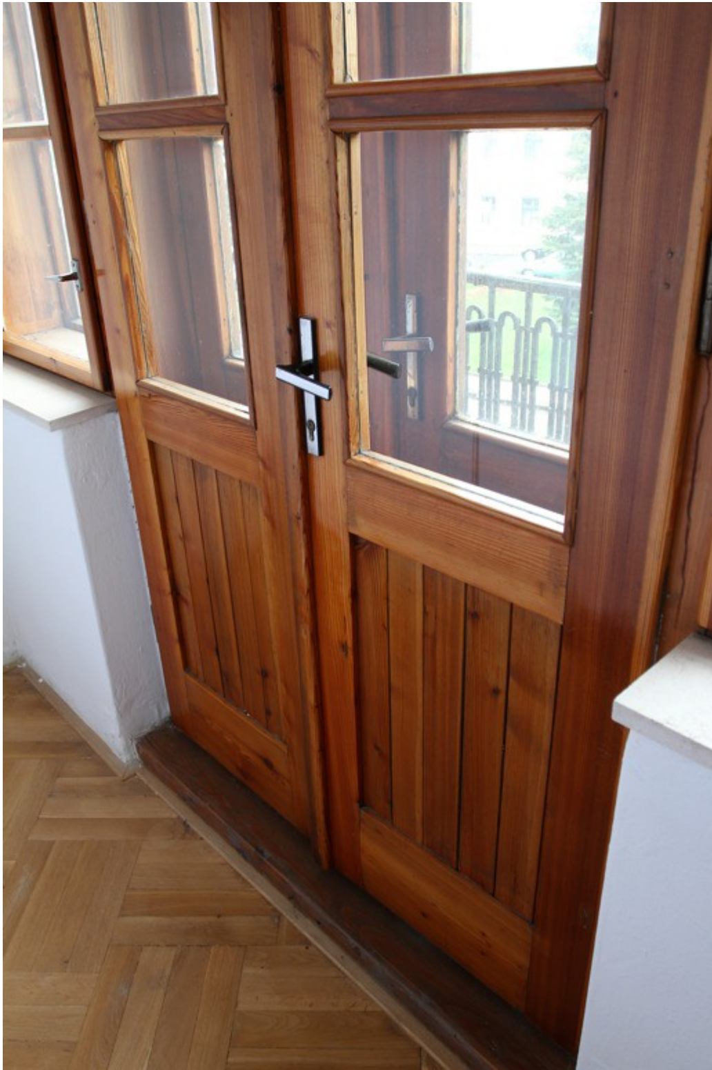
2.a Balkonové dveře, expozice