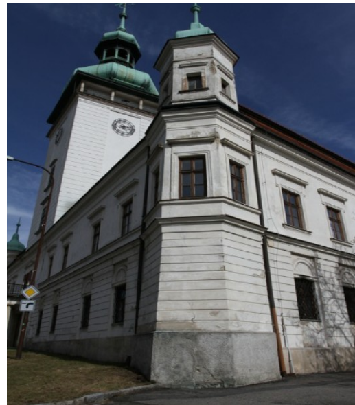
4. Pohled na JZJV stranu