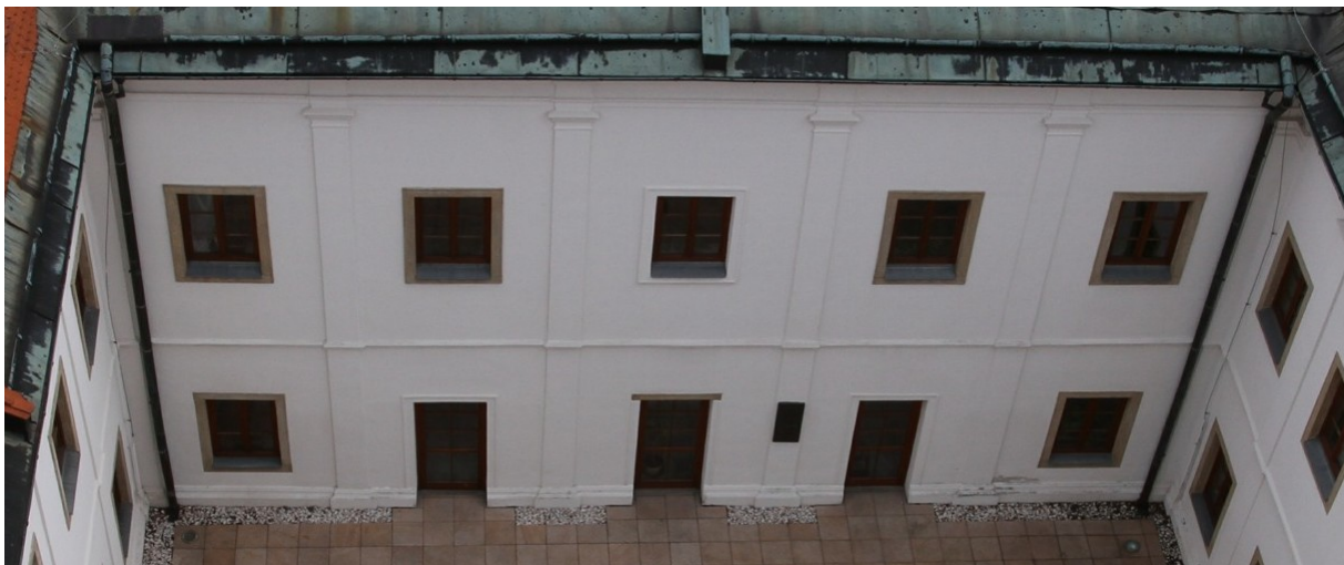
5. Omítka atrium (původní poškození do 0,5 m vlhkostí – dnes opravená)