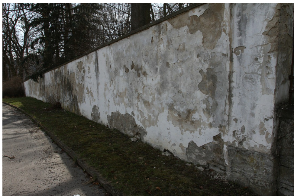
5. Poškození zdiva