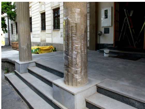
1. Detail zavlhčení sloupu 08/2015 po 24 hodinách