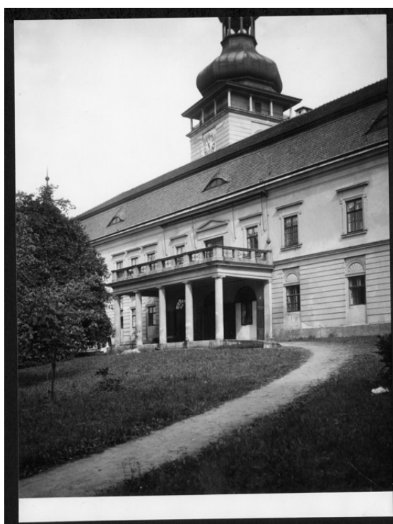
4. Původní stav z 20. let 20. století