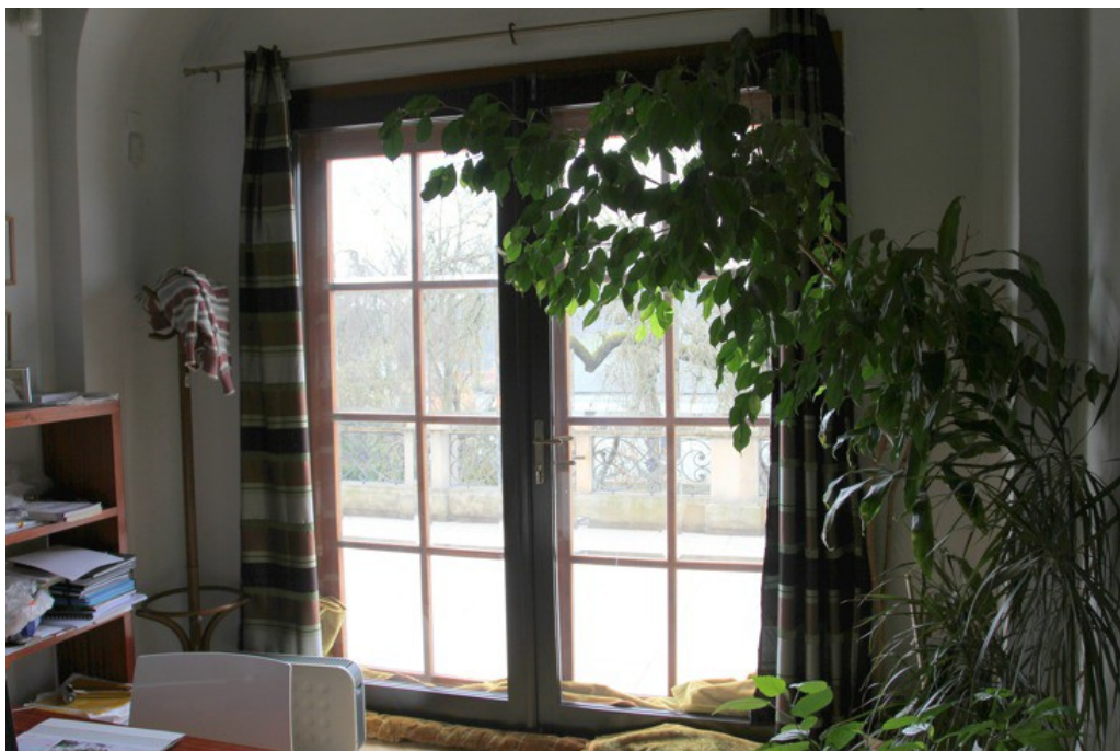
1.a Dveře na balkón, ředitelna