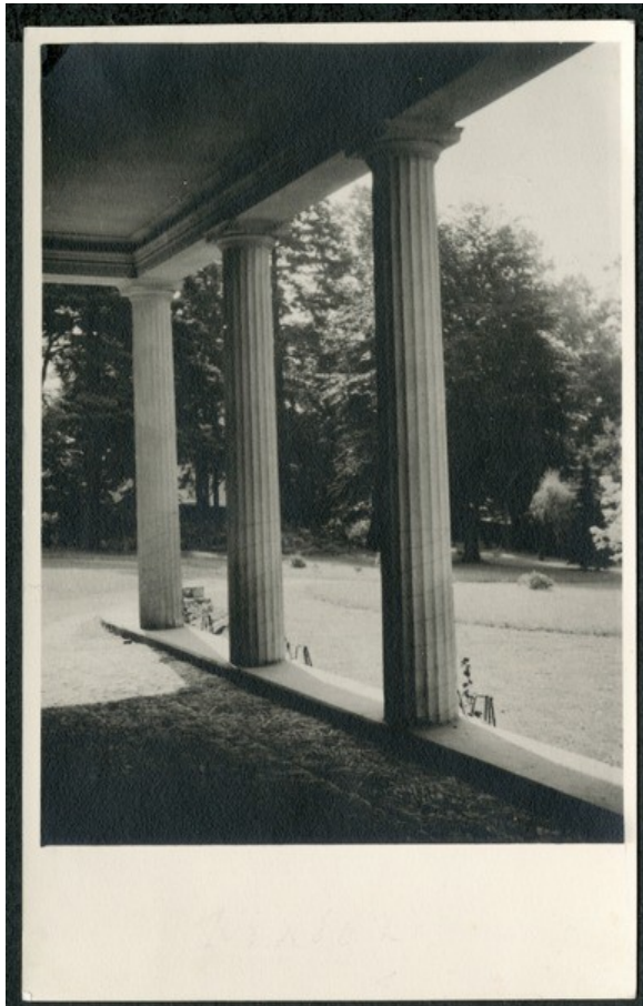
5. Původní stav z 20. let 20. století