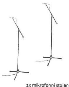
2x mikrofonní stojan