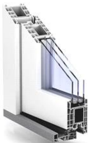
Classic 76 vchodové dveře - 5 komorový 76mm profil

CLASSIC 76 (hranatý design stavební hloubka 76mm, izolační trojsklo Ug = 1,1 W.m-2.K-1 , sendvičová výplň 24 mm)