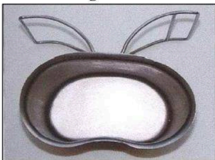
vzorová fotografie č. 7