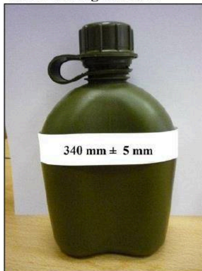
vzorová fotografie č. 4