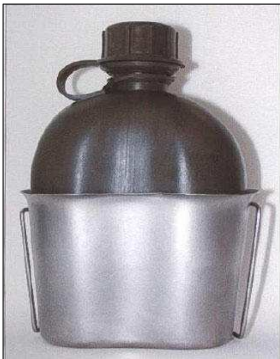
vzorová fotografie č. 1