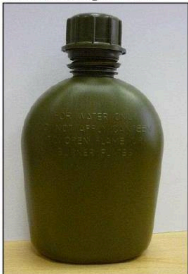
vzorová fotografie č. 3