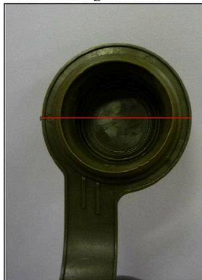
vzorová fotografie č. 6