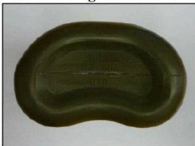
vzorová fotografie č. 5