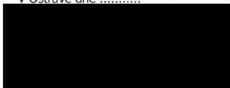
Jarmila Uvírová na základě pověření hejtmana kraje