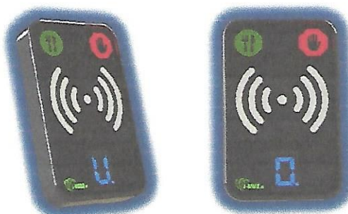
Čtečky zobrazující druh jídla strážníkoví