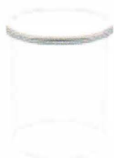
AC-300 | 71005911

• římé napojení na viko kondenzoru; průměr komory 300 mm; výška komory 370 mm