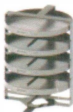
ST-250-4-S | 71017911

• římé napojení na viko kondenzoru; průměr komory 300 mm; výška komory 370 mm