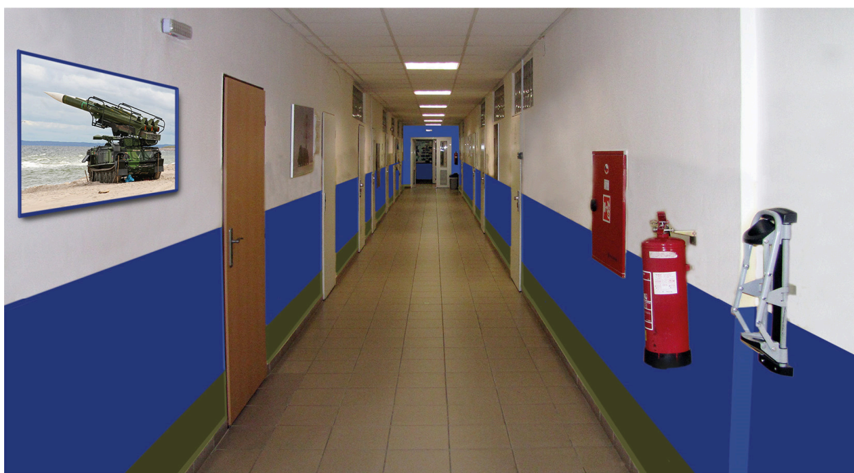
Návrh výtvarného řešení chodeb budovy velení 25. protiletadlového raketového pluku Strakonice. Modrý pruh do výše štítků klik a khaki zelený pruh ve spodní části stěn vyjadřují činnost pluku, střelbu ze země směrem k nebi. Čela chodeb budou modrá až ke stropu aby se chodby opticky zkrátily.