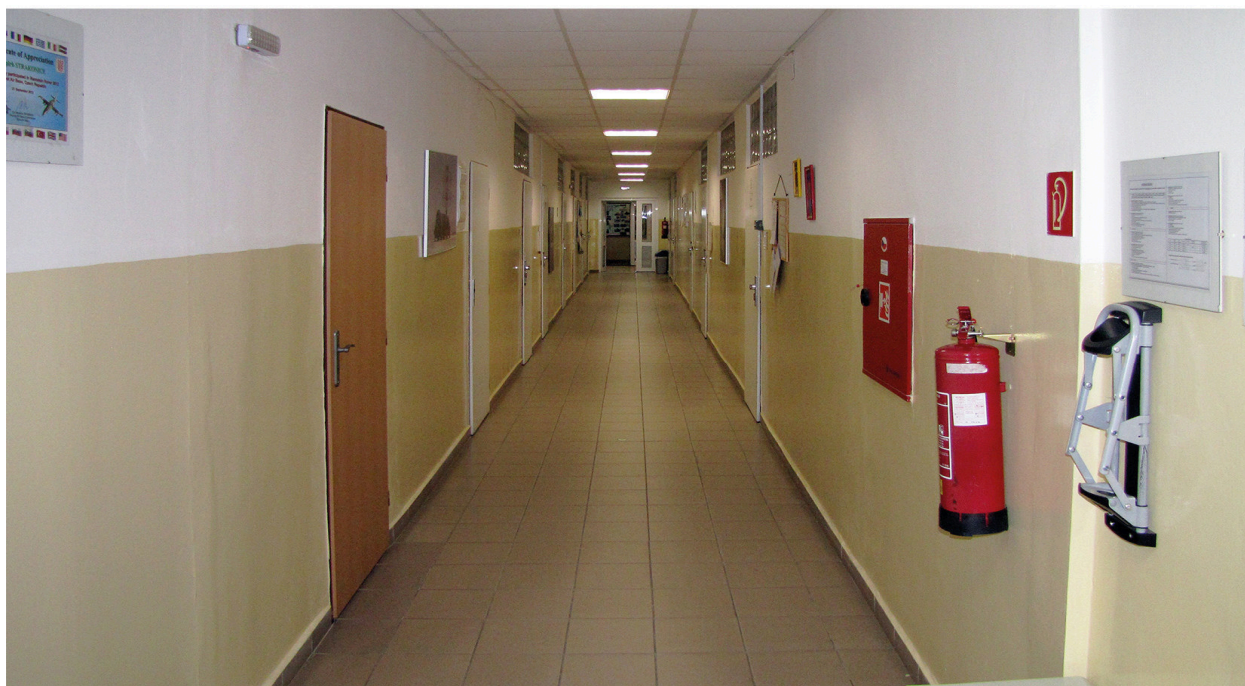
Současný stav chodeb budovy velení 25. protiletadlového raketového pluku Strakonice.