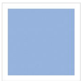
RAL PR847 – modrá

Požadované barevné provedení šuplíků a dvířek