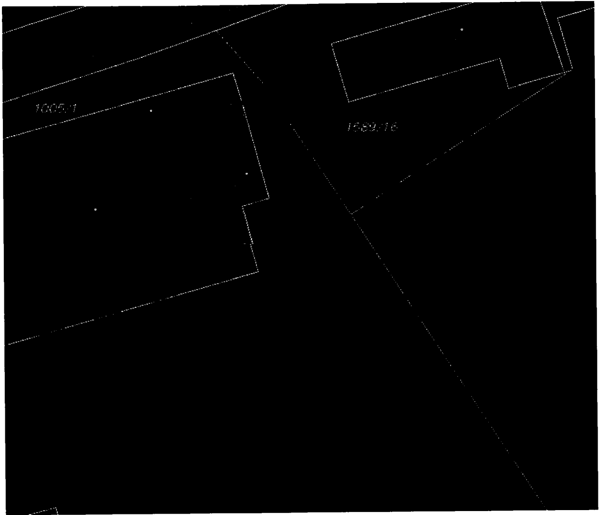
Část pozemku 1005/31 – 500 m 2