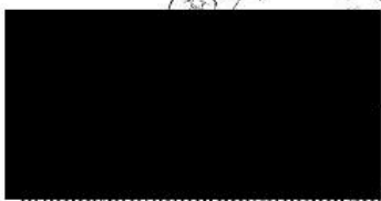
Bc. Jana Vlnasová starostka města Dobříše