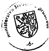
Mgr. Richard Brabec ministr

XII. Toto opatření nabývá účinnosti dnem 1. 12. 2017.“