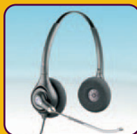
Se dvěma sluchátky