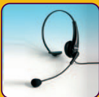
S jedním sluchátkem