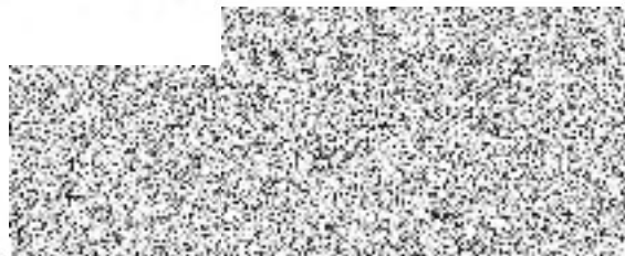
za Zhotovitele – razítko a podpis Ing. Milan Valouch - jednatel