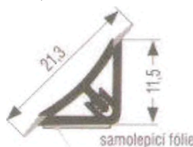
Obr. 1 Příklad provedení těsnícího profilu

Požadováno je světlostálé provedení. Součástí dodávky kuchyňské linky je i tzv. těsnící profil (lišta) uvedená jako příklad na obr. 1 k zajištění izolace přechodu mezi pracovní deskou kuchyňské linky a stěnou (barevné provedení ve stejném odstínu jako pracovní deska, uvedené rozměry jsou pouze doporučené).