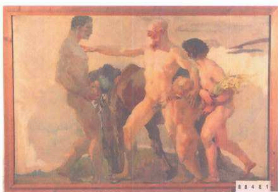
i.č. 88 481, Ludvík Vacátko, Koně a čtyři nahé postavy , olejomalba, 117 x 167 cm, 150 000,- Kč