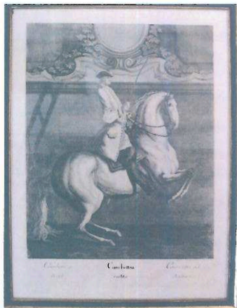
i.č. 22 482, Johann Elias Riedinger, Vysoká škola jezdecká, rytina, 60 x 43 cm