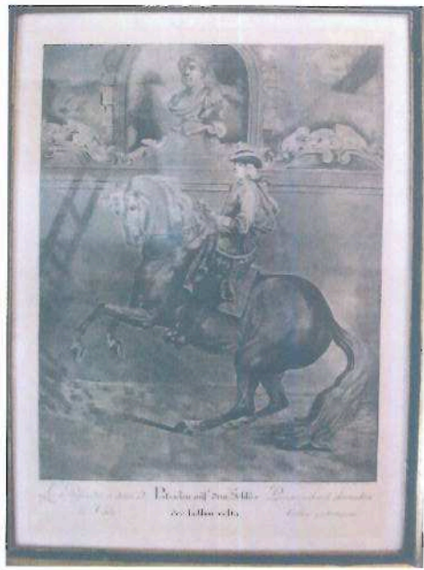
i.č. 22 495, Johann Elias Riedinger, Vysoká škola jezdecká, rytina, 60 x 43 cm