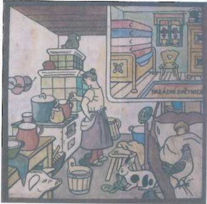
i.č. 45 971, Josef Lada, Stará vesnická kuchyně , 1948, tempera, 105 x 105 cm, 750 000,- Kč