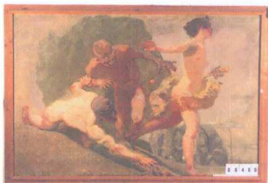
i.č. 88 489, Ludvík Vacátko, Dva nazí muži a jedna nahá žena , olejomalba, 117 x 200 cm, 200 000,- Kč