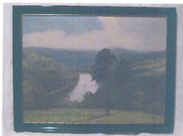
i.č. 112 851, Jaroslav Holeček, Západ slunce-Vltava u Orlíku , olejomalba, 56,5 x 71,8 cm, 2 000,- Kč