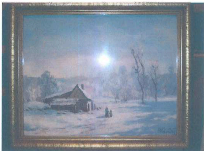
i.č. 112 364, F. Krejčí, Zasněžená chalupa, olejomalba, 46 x 55 cm