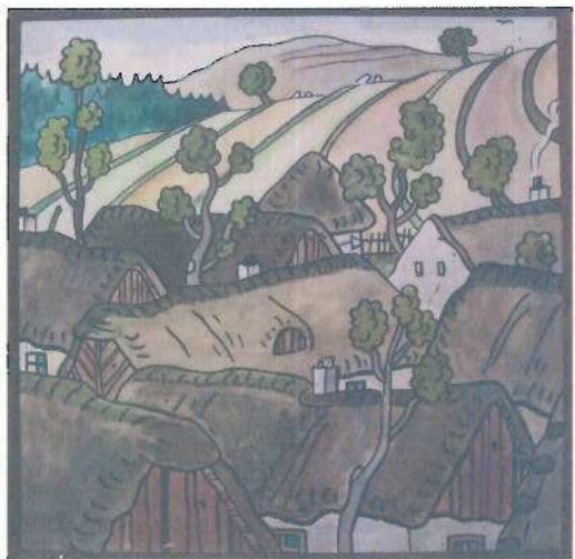
i.č. 88 477, Josef Lada, Stará vesnice , 1948, tempera, 105 x 105 cm, 750 000,- Kč