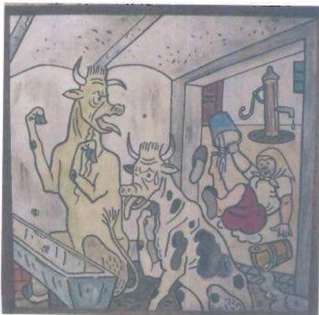
i.č. 45 973, Josef Lada, Starý chlév bez mechanizace , 1948, tempera, 105 x 105 cm, 750 000,- Kč