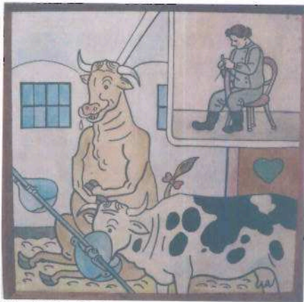
i.č. 45 972, Josef Lada, Mechanizovaný chlév , 1948, tempera, 105 x 105 cm, 750 000,- Kč