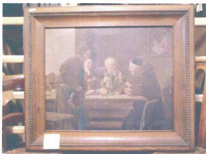
i.č. 112 346, Neznámý autor, Pohoštění návštěvy v klášteře, olejomalba, 73,5 x 84,5 cm