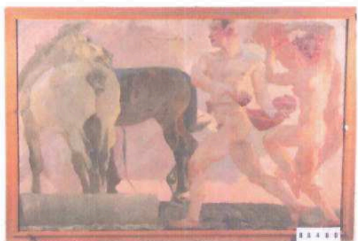
i.č. 88 480 , Ludvík Vacátko, Koně a dvě nahé postavy , olejomalba, 117 x 167 cm, 150 000,- Kč