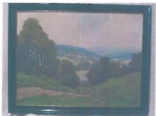
i.č. 112 850, Jaroslav Holeček, Letní nálada z Českomoravské vysočiny , olejomalba, 56,5 x 71,8 cm, 2 000,- Kč