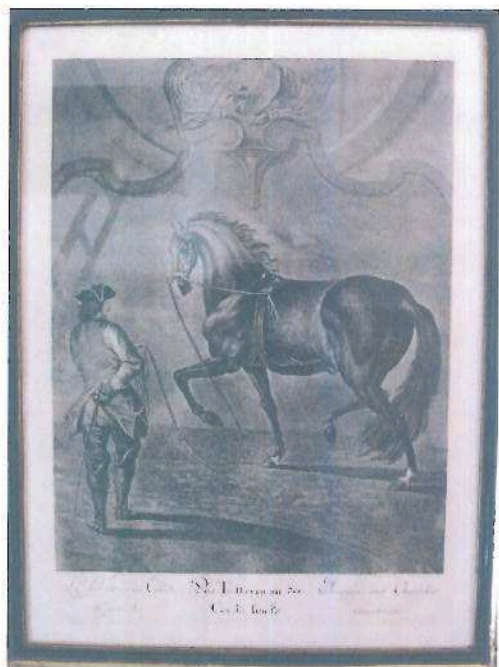
i.č. 22 483, Johann Elias Riedinger, Vysoká škola jezdecká, rytina, 60 x 43 cm