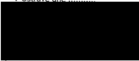
Jarmila Uvírová na základě pověření hejtmana kraje