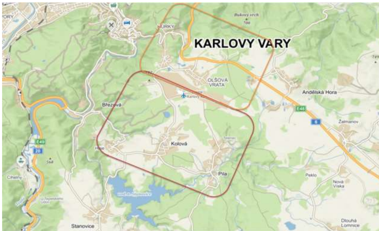
Obrázek 1 Tvary leteckých okruhů