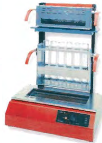
InKjel 625 M