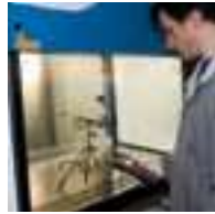
AIR FLOW SPEED TEST