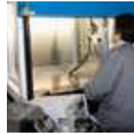
NOISE LEVEL TEST

Each Faster cabinet is tested conforming to EN 12469:2000, EN 61010:2001 and released with FAT certificate of the tests performed.