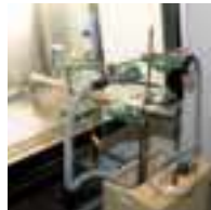
KI DISCUSS TEST

Each Faster cabinet is tested conforming to EN 12469:2000, EN 61010:2001 and released with FAT certificate of the tests performed.