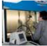
FILTER LEAKAGE TEST