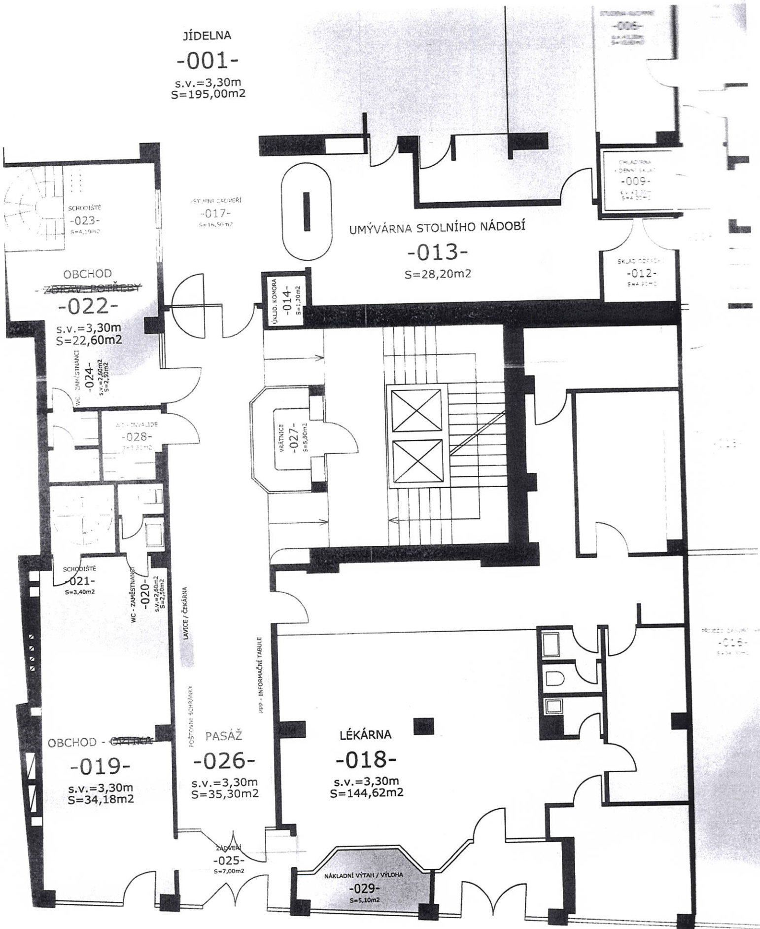
Schéma 2.4.1 - Stávající provozní schéma PRÍZEMÍ Vypracoval: Ing. Wachtl

MPP, VÝLOHA, VRÁTNICE, WC INVALIDŮ LAVICE / ČEKÁRNA, POŠTOVNÍ SCHRÁNKY, INFORMAČNÍ TABULE