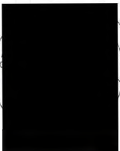
Příloha č.1 - Orientační situace staveb