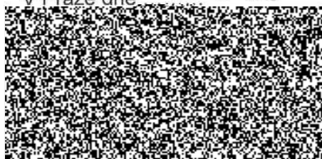
vedoucí OMM SLZ PP ČR