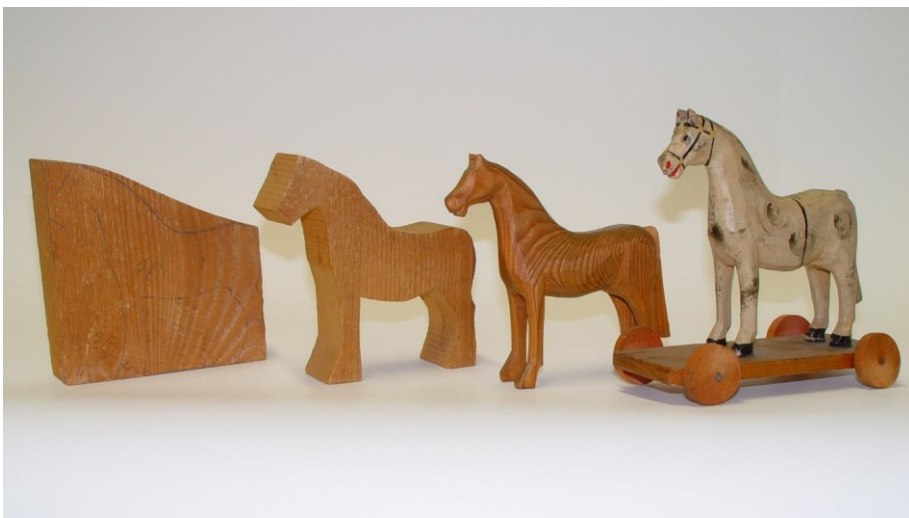
Postup výroby koníka 4 ks EH-00551a-b, EH-01059, EH-01057