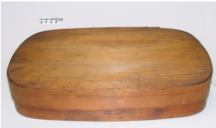
Krabice z loubků EH-00747