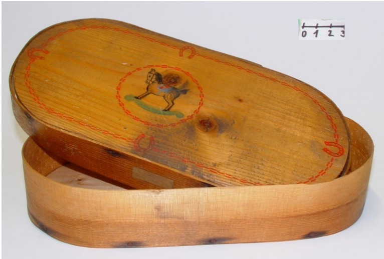
Krabice z loubků EH-00753