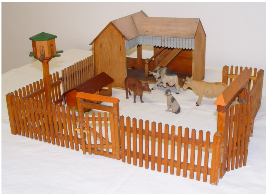
Areál venkovského statečku: holubník EH-00506; kůlnička EH-00696; budova s částí plotu EH-00701; plot v částech EH-00703a-c; kravky EH-00743, EH-00841, EH-00844; pes EH-00862