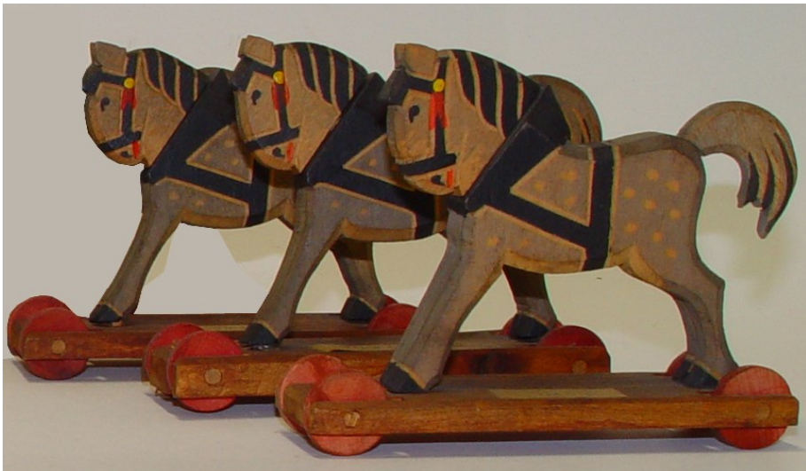
Pojíždňé figurky koníků – 3 ks EH-00366a-c