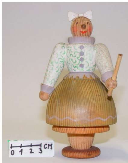
Soustružené figurky 4 ks EH-00509, EH-00510, EH-00513, EH-00516