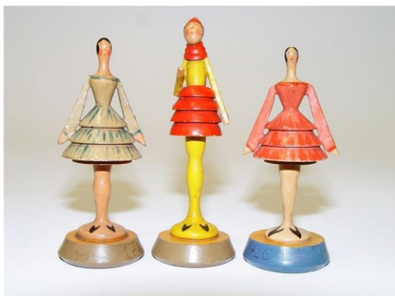
Soustružené figurky, práce žáků hračkářské školy EH-00525, EH-00527, EH-00526