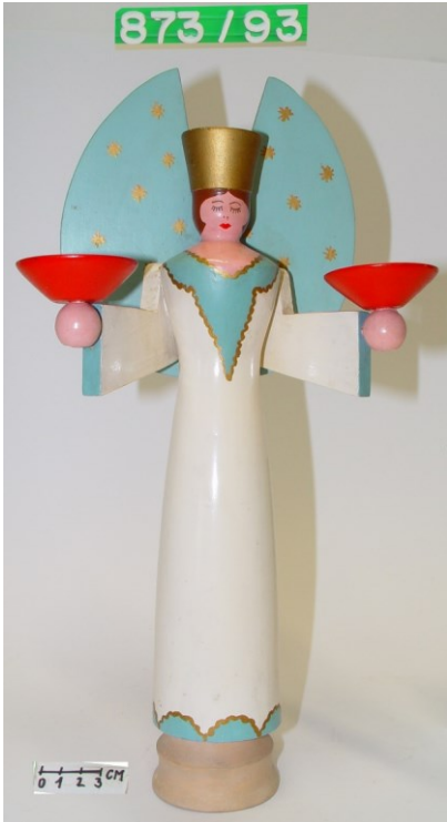
Světloňoši Přír.č. 0873/93, Přír.č. 0872/93