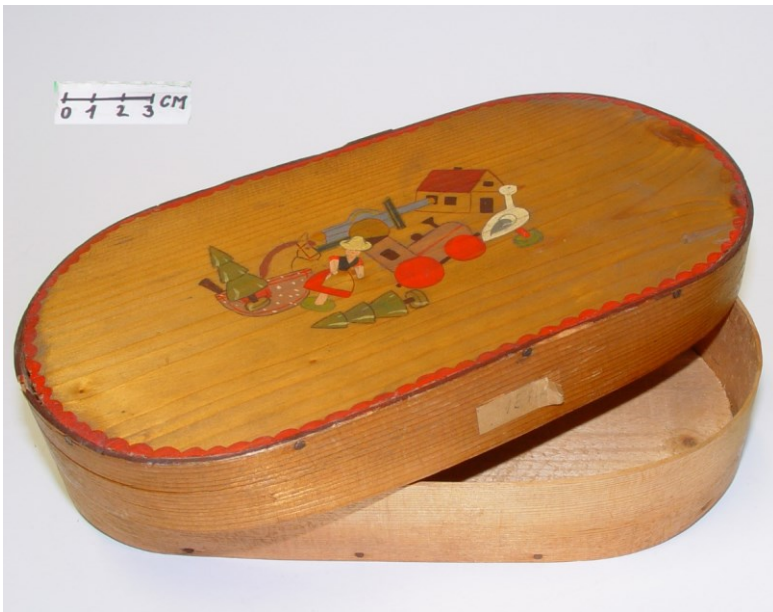
Krabice z loubků EH-00754