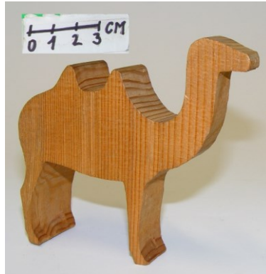
Polotovary hraček odseknuté ze soustružených prstenců EH-00537, EH-00536