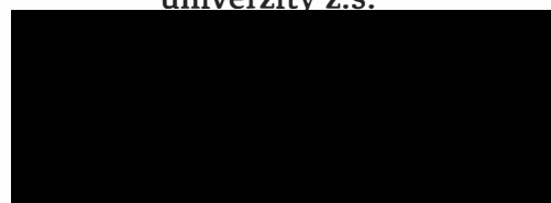
Studentská unie Jihočeské univerzity z.s.