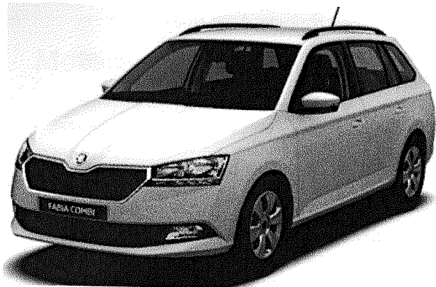
VŮZ Č.1 ŠKODA FABIA COMBI,ŇJ