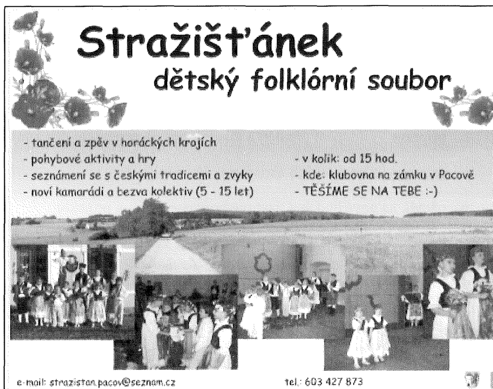
Obrázek 1: Plakát pro nábor dětí umístěn na webu, ve školách, školkách aj.

a mládeží je pro kulturní tradice velmi důležitá. Dochází tak k zachování lidových tradic a folkloru na Českém Horácku a zároveň jsou pro děti a mládež připraveny aktivity, které napomáhají plnohodnotnému využívání volného času této zájmové skupiny. Zabráňují negativním sociálním jevům, např. potulování dětí, sduřování