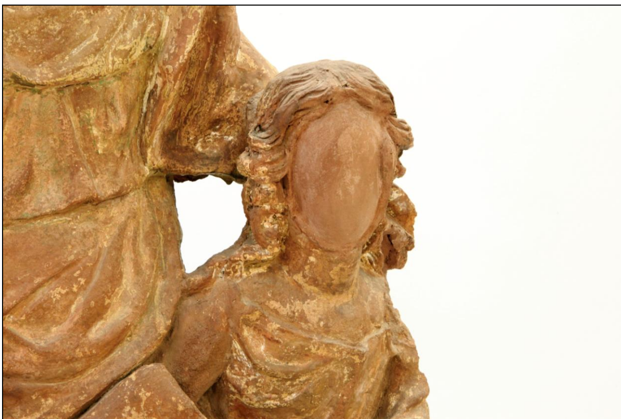
Detail poškozené a vytmelené hlavy P. Marie.