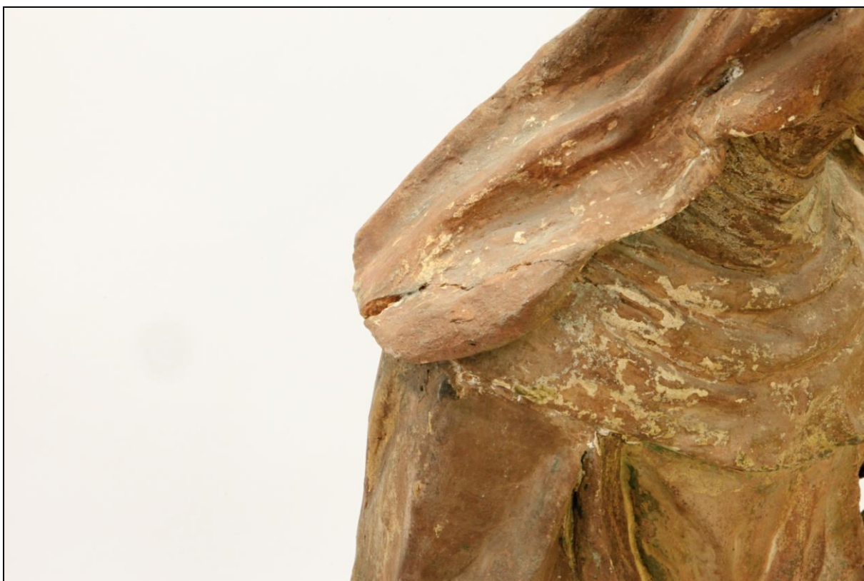
Detail lepené části a praskliny v šátku sv. Anny