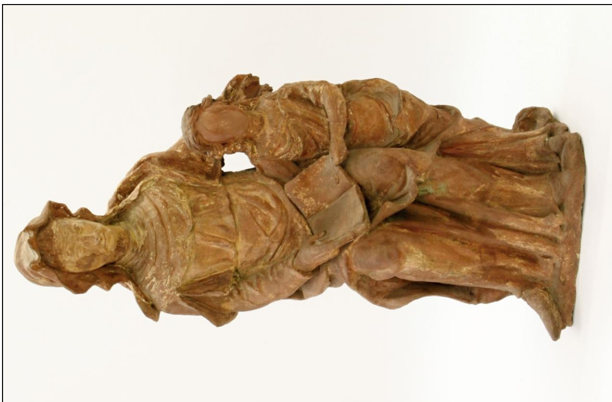
Pohled na sousoší zředu