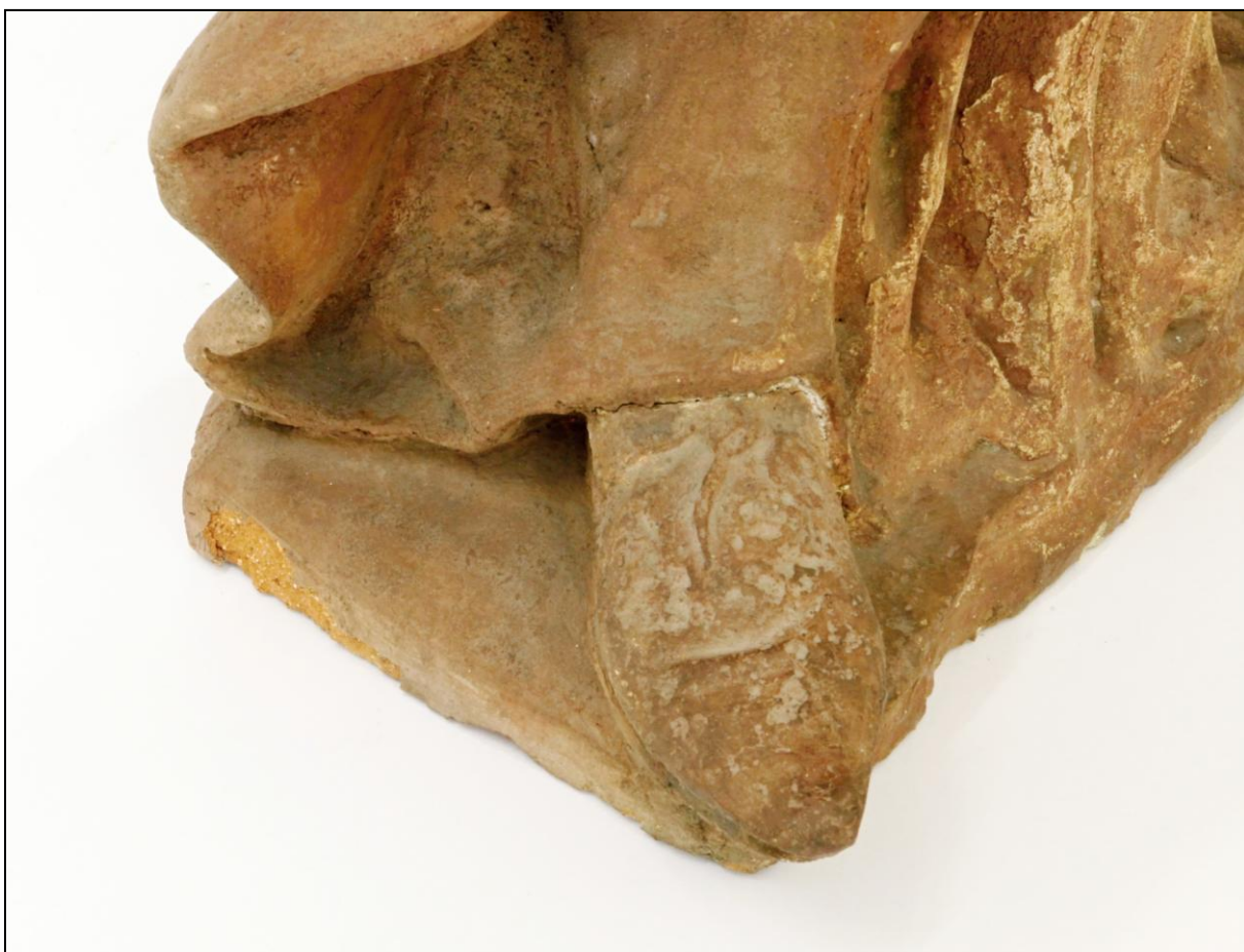
Detail nohy sv. Anny