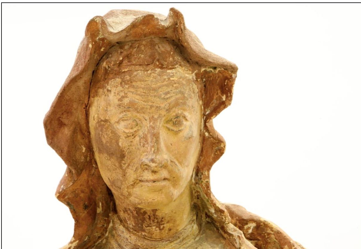
Detail hlavy sv. Anny s dochovanou polychromií.