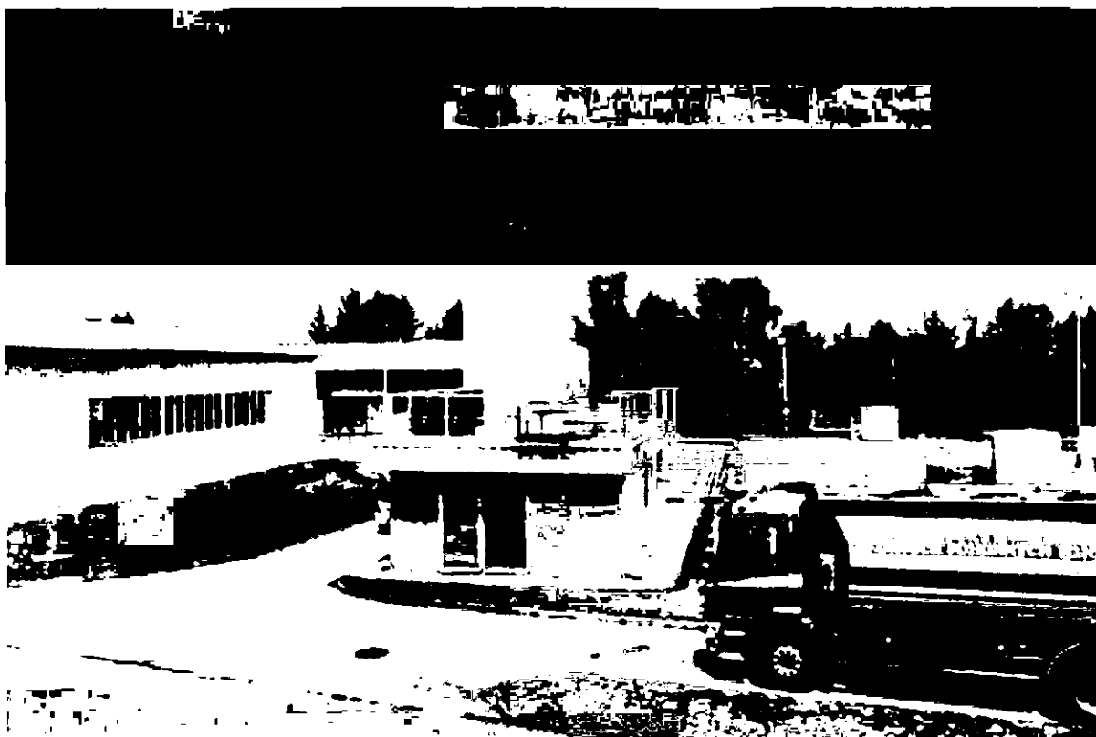
Obr. 1 – Rekuperační jednotka

Přesná specifikace rozsahu prací a dodávek pro konkrétní VRU bude provedena na základě objednávky Objednatele.