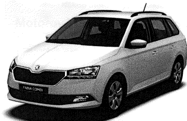
VŮZ Č.4 ŠKODA FABIA COMBI,NJ