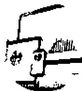
Analýza dat v prostředí webové aplikace SensMax SensWeb