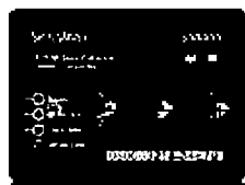
SensMax TCPIP Přenos dat přes počítačovou síť