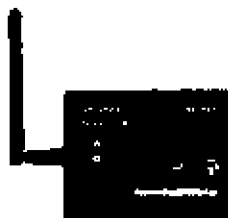
SensMax 3G Přenos dat pomocí mobilního signálu