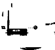
Z datového sběrače přes místní síť nebo GPRS do webové aplikace