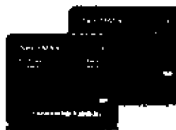
SensMax Pro D3/DE sčítání v interiérech s rozlišením směru