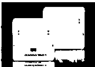
SensMax Pro S1/SE sčítání v interiérech bez rozlišení směru