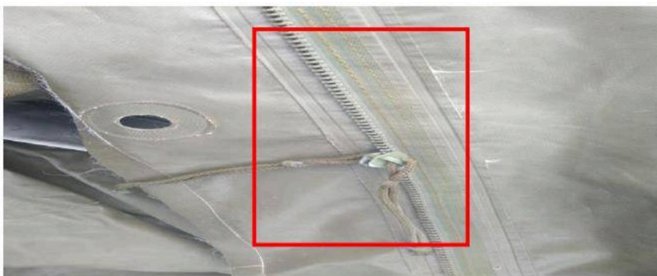
rozbitý zip poškozený jezdec

Výměna starých zipů za nové zipy a zipy posunout na límeček, vyměnit za nové oko, vyměnit za nové držáky sluneční clony.