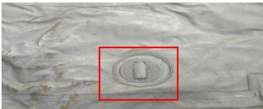
utržené kotvící oko

Na všechny zipy bude nažehlen pásek – klínek plachtoviny, aby bylo možné stany zapínat. Díky přidělaným klínekům se sníží pnutí zipů a švů.