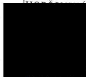
starosta Město Horšovský Týn Příkazce