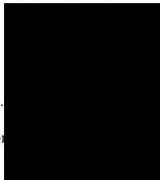
Mikroservisní společnost s.r.o. z pověření ..... rovolný