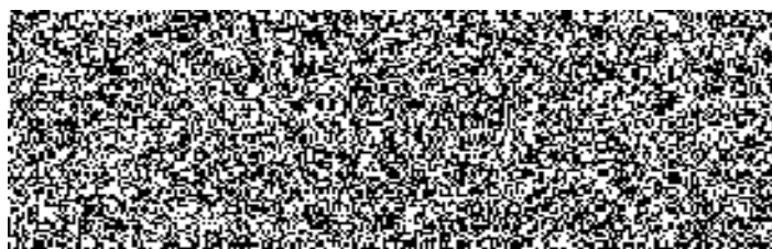
Petronela Rosová Specialista zákaznických služeb III