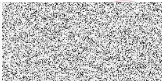
Město Vsetín starosta