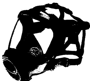
Dräger FPS 7000 Maska s konektorem P