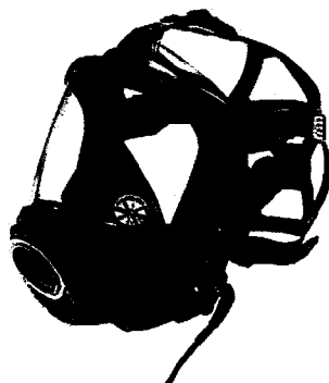
Dräger FPS 7000 Maska s konektorem P a komunikačním zařízením FPS Com

Nová celoobličejová maska řady Dräger FPS 7000 určuje nový standard v bezpečnosti a pohodlí uživatele. Díky důsledně propracované ergonomii, dostupnosti v různých velikostech, velkému zornému poli, velmi pohodlnému a bezpečnému utěsnění na obličeji a široké paletě modifikací a volitelného příslušenství se tato maska řadí mezi nejlepší produkty ve své kategorii.