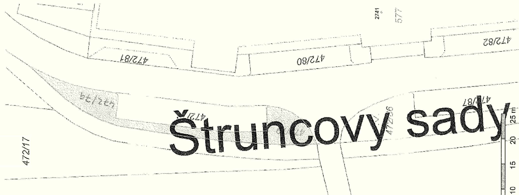
obr. č. 1)