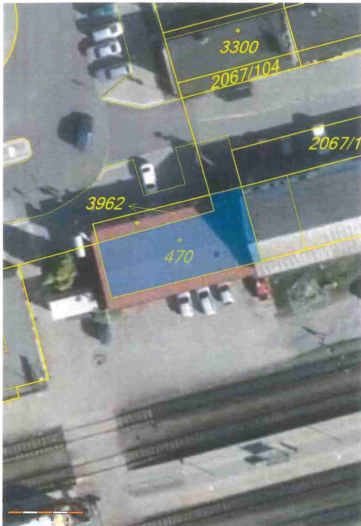
Příloha č. 1 situační plán budovy