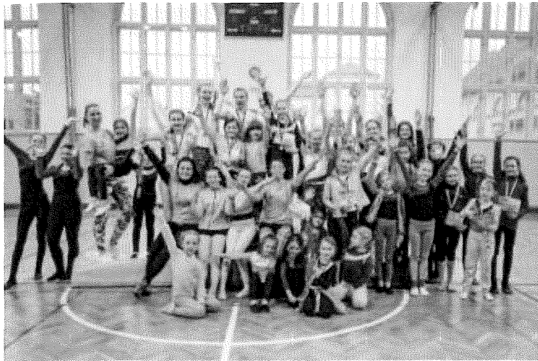
Vítězové závodů v gymnastice a šplhu, Moravské Budějovice

Účastníme se soutěží a závodů, které organizuje Sokolská župa plk. Švece (krajská úroveň), Česká obec sokolská (celorepubliková úroveň) a sportovní spolky v okolí (regionální úroveň).