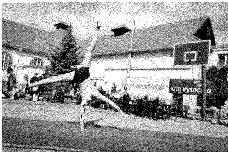
Sport propagujeme na našich akcích nebo vystupujeme na dalších akcích pro veřejnost v našem regionu

Pořádáme vlastní akce na propagaci sportu - Sokol Open, Mikulášské sportování, letní sportovní soustředění.