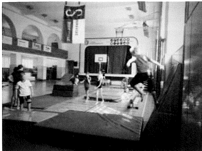
Letní sportovní soustředění

Součástí projektu je letní soustředění, které trvá 5 dní. Každý den budeme trénovat disciplíny, kterým se věnujeme po zbytek roku (parkour, gymnastika, atletika, plavání).