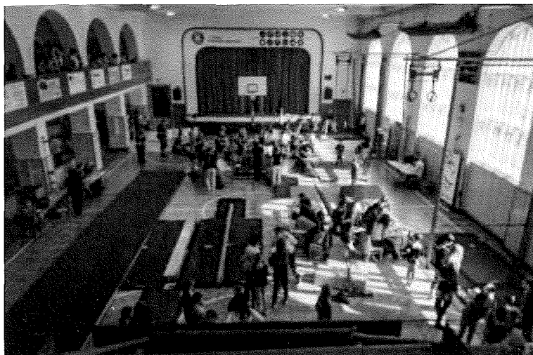
Přebor Župy plukovníka Švece ve všestrannosti, Moravské Budějovice

Kromě pravidelné denní činnosti každoročně organizujeme závody, turnaje, soutěže i společensko-sportovní akce.