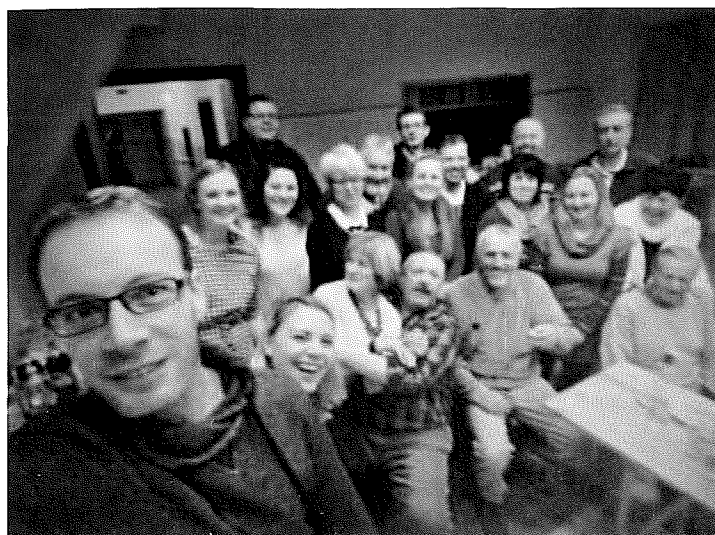
Trenéři TJ Sokol Moravské Budějovice (pouze část ze všech trenérů)

Veškeré věci pořízené z projektu využijeme při celoroční činnosti.