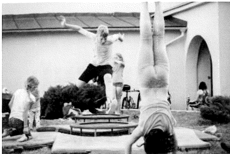
Když je hezky, cvičíme venku

TJ Sokol Moravské Budějovice navštěvuje 285 dětí do 18 let. Oddíly Parkouru a Gymnastiky a všestrannosti navštěvuje 140 dětí, tj. cca 50% věch mládežnických kategorií.