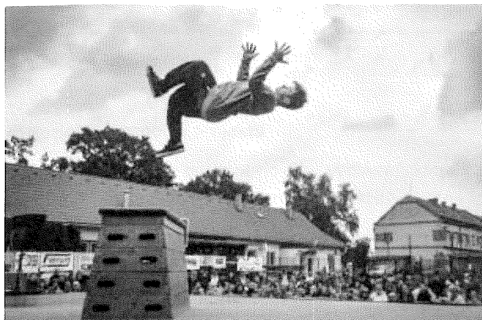
Akce pro veřejnost Sokol Open, na které prezentujeme naši činnost

Ačkoli nám primárně nejde o výkonnostní sport, pravidelně se účastníme soutěží krajské úrovně. Nejlepší děti každoročně postupují na soutěže celorepublikové.