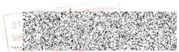
Razítko a podpis