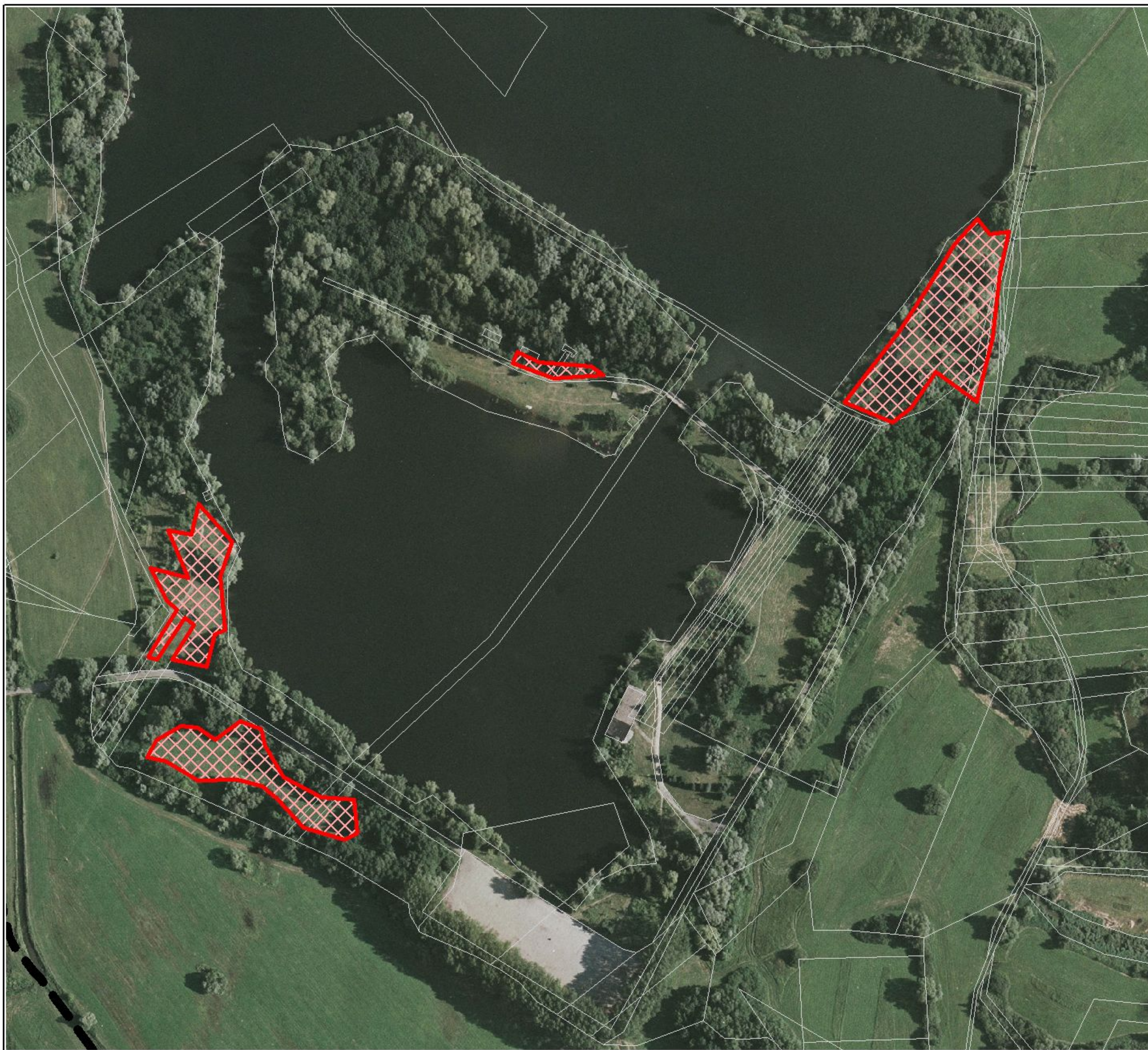
Vytvořeno v prostředí ArcView GIS