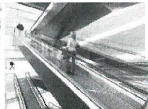
Eskalátory & pohyblivé chodníky