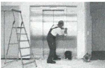
Servis 24 hodin