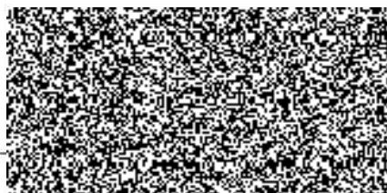
jednatel B2 Assets s.r.o. za Pronajímatele