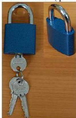
Fotografie zámek visací ( položka 37 )